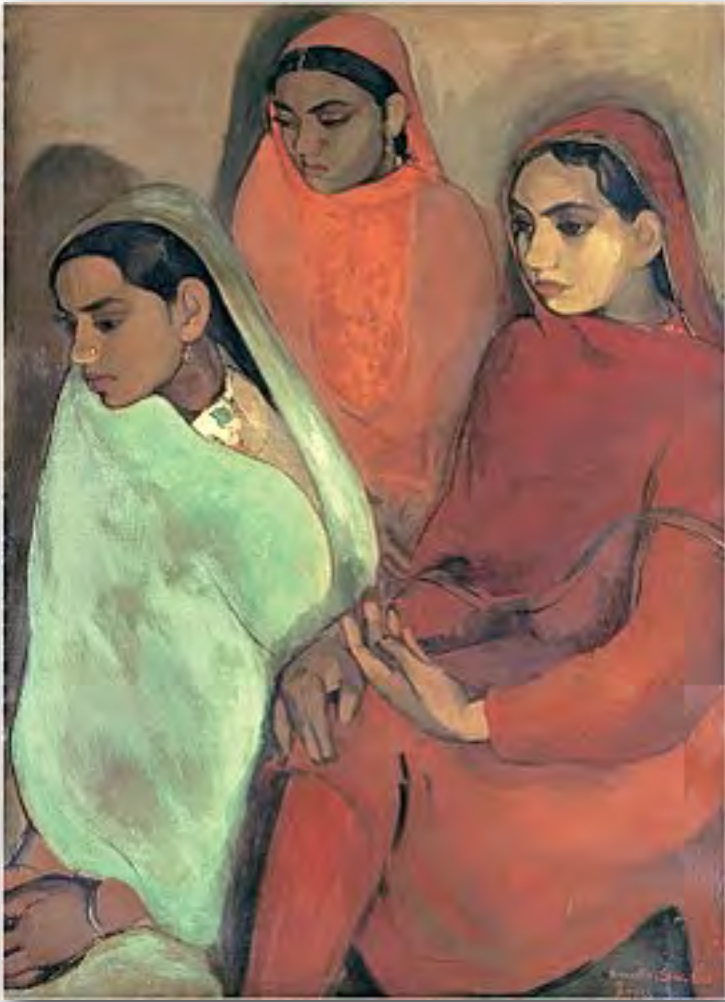
Group of Three Girls, 1935