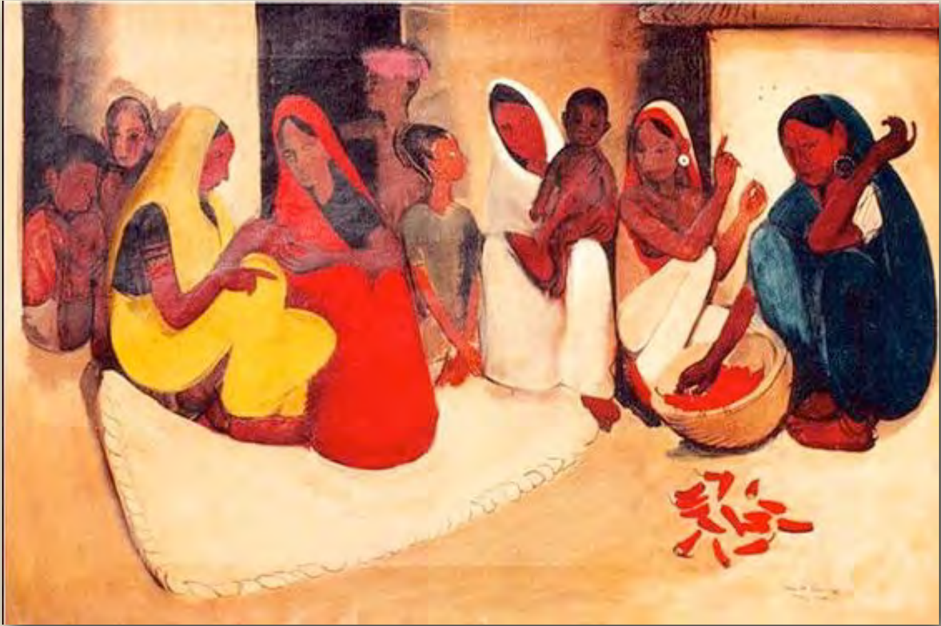
By Amrita Sher-Gil, Village Scene, 1938