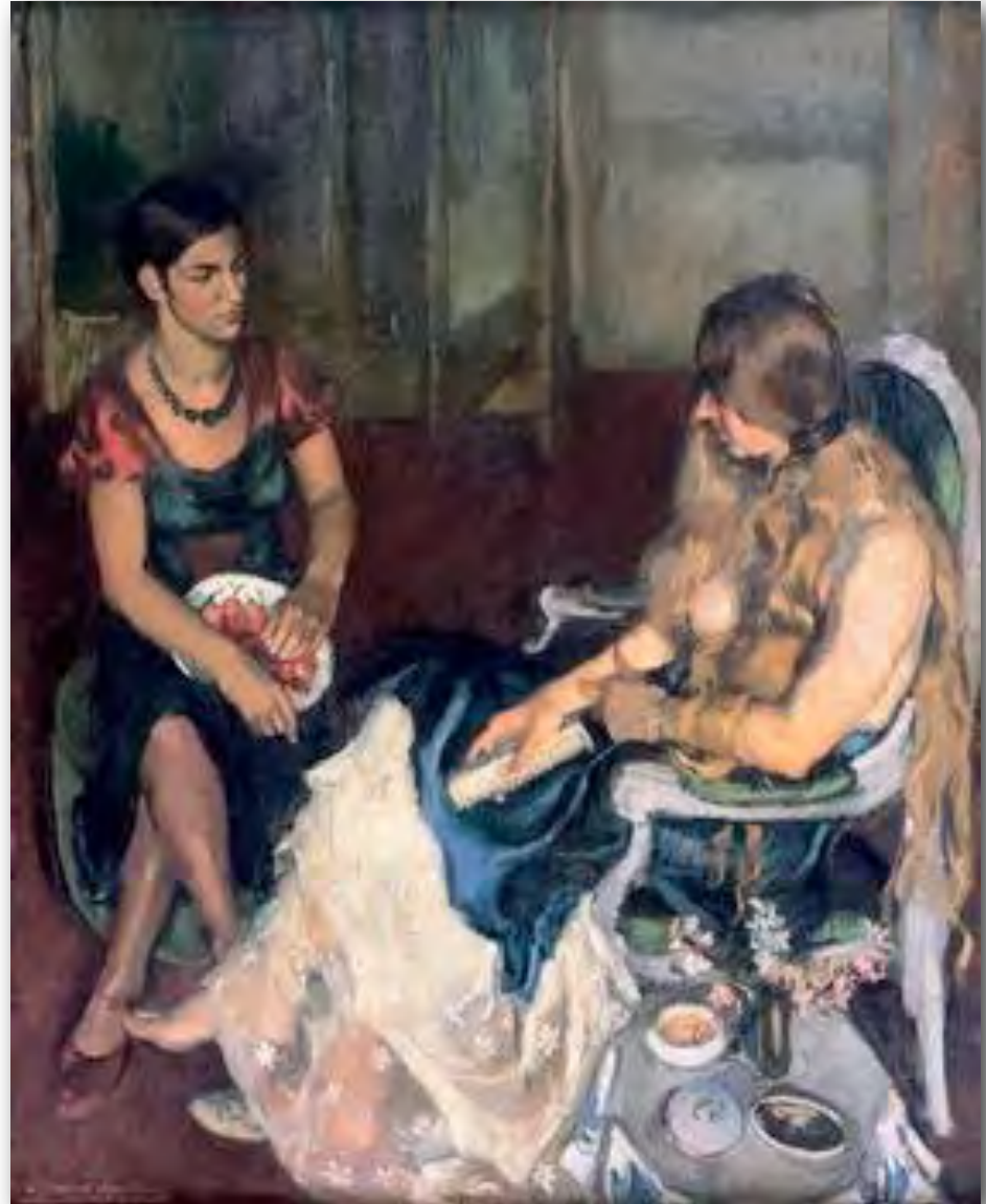
By Amrita Sher-Gil, Young Girls, 1932, oil on canvas, National Gallery of Modern Art, Delhi