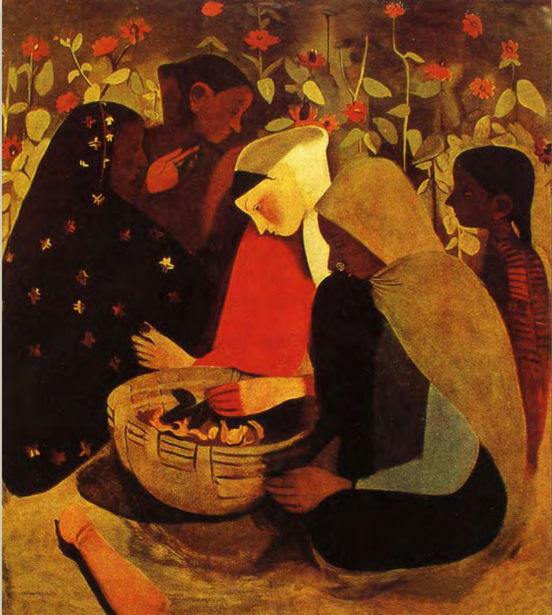
By Amrita Sher-Gil, Village Scene, 1938