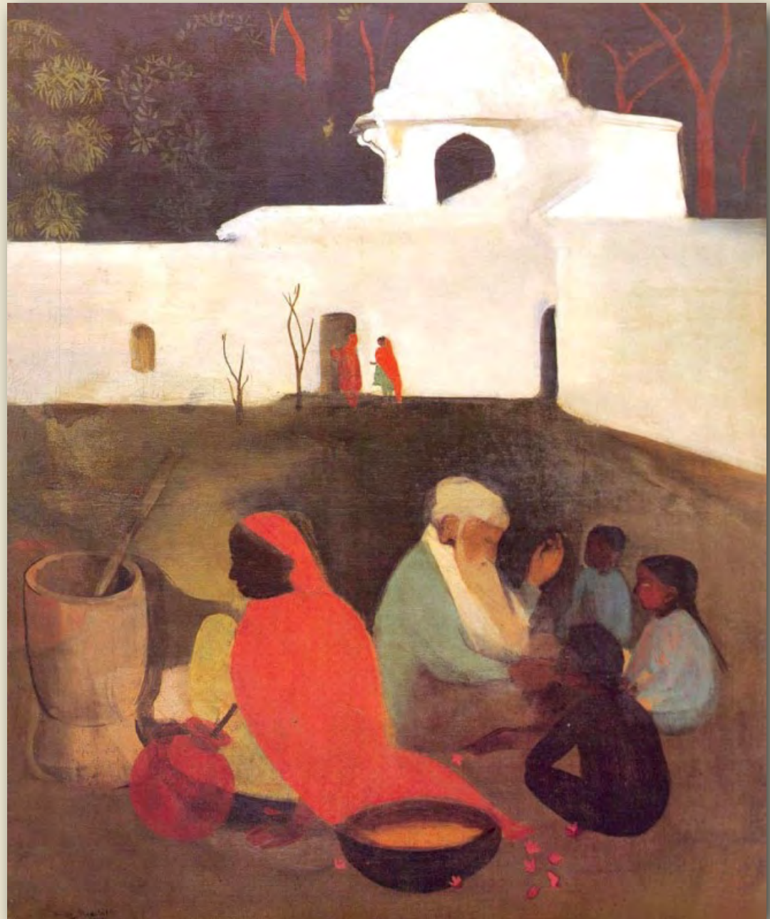
By Amrita Sher-Gil, Ancient storyteller painting