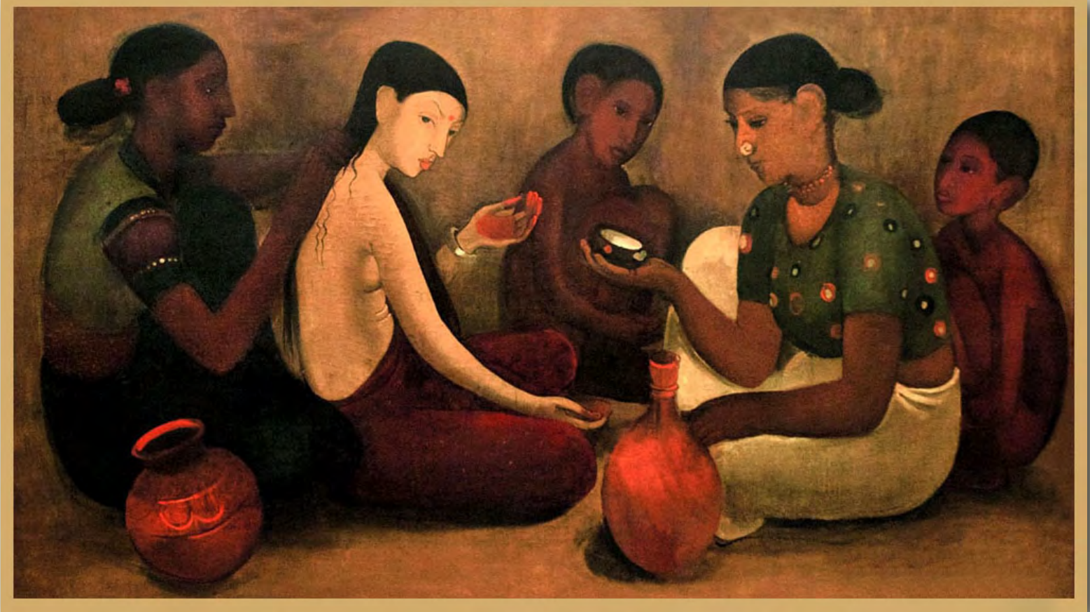
By Amrita Sher-Gil, Bride's Toilet, 1937