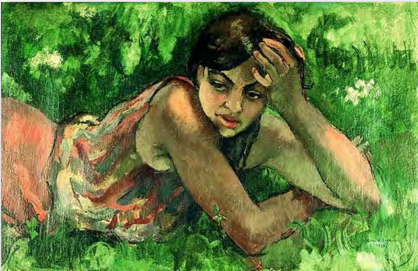
Hungarian Gypsy Girl, 1932