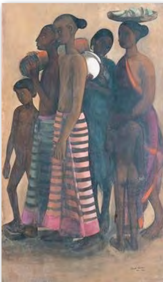
South Indian Villagers Going to Market, 1937.